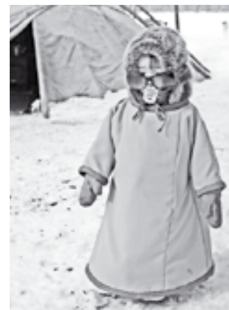
Дети на стойбище - мал мала меньше

- Олени убежали. Зашли в ручей, там корм получше, сено, и лес вокруг теплее, -