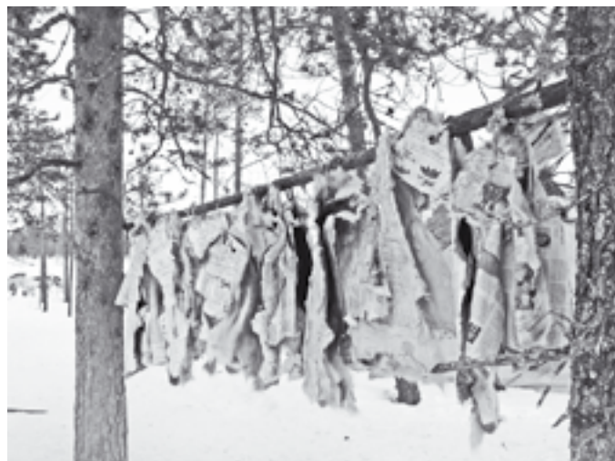
В обязанности чумработницы входит выделка шкур...

На столе появятся сахар, чай, варенье, колбаса, масло, сгущенка, печенье.