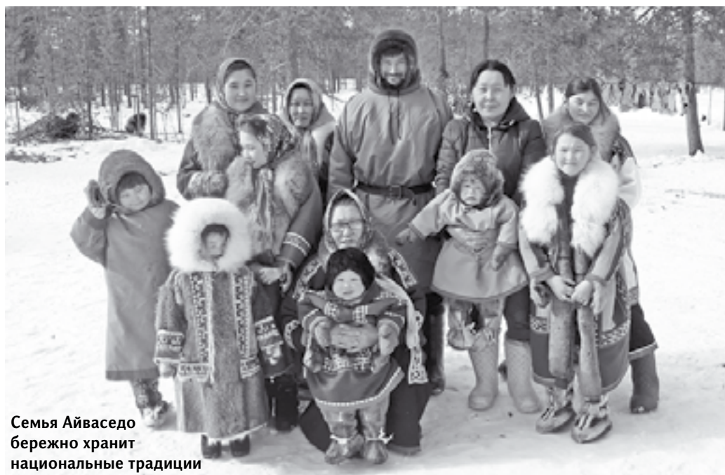
Семья Айваседо бережно хранит национальные традиции

на каком-то выборе он не будет, в душе, скорее всего, надеется, что оленей и тундру тот будет любить так же сильно, как и он сам. При